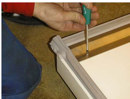
Flytta listhållare o släpplista till andra änden av dörrblad