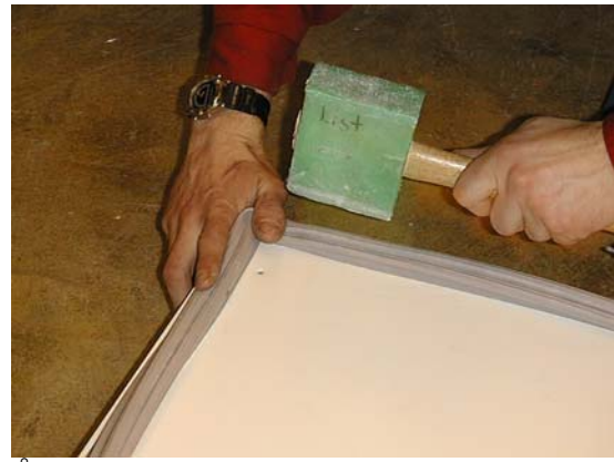
Återmontera tätningslist (såpvatten gör gott!)