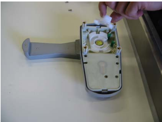
Byt vit plastinsats (från vä till hö, eller omvänt)