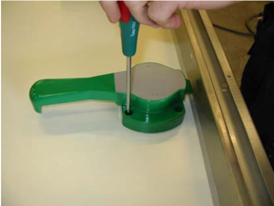
Lossa innerhandtaget. Byt retur fjäder till en med annan riktning.