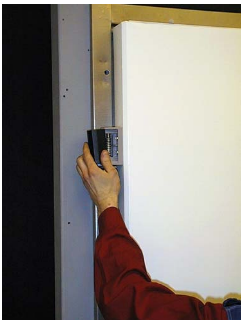
Lossa gångjärnens täckåpor. Viktigt!