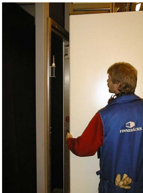
Demontera dörrbladet från karmen. Lyft rakt upp