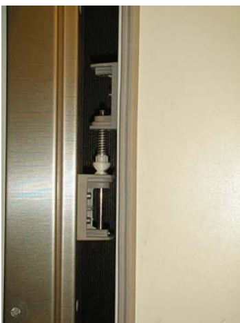
Häng tillbaka dörrbladet på karm och montera täckkåporna. KLART!