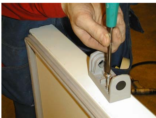
Lossa gångjärnen och vrid runt 180 gr.