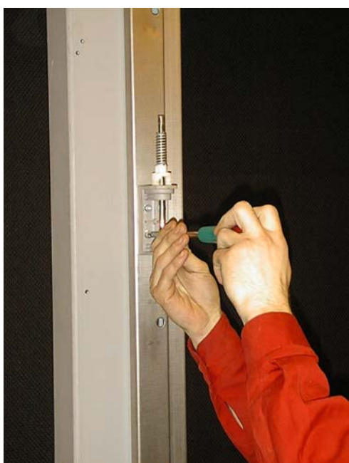
Flytta gångjärnen till karmens andra sida