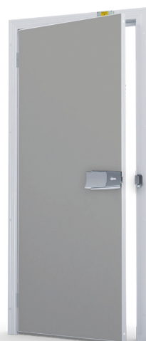
Kulör RAL 7004