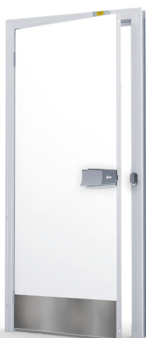
Slitskydd Rfr 250 mm