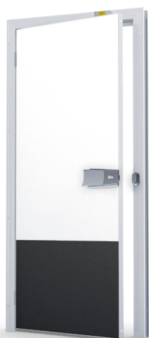
Slitskydd PC 625 mm