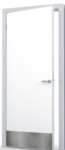
Slitskydd Rfr 250 mm