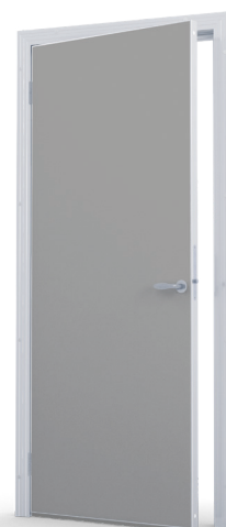
Kulör RAL 7004