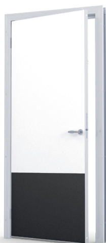
Slitskydd PC 625 mm