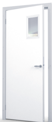
Siktruta 240x400 mm